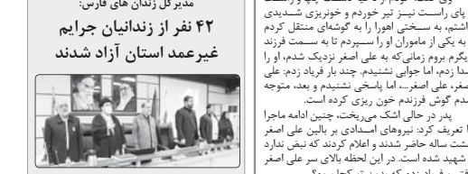
مراسم آزادسازی ۴۲ نفر از زندانیان جرائم غیر عمد استان فارس با همت استاندار فارس و حضور جمعی از مسئولین و کادر زندان آزاد شدند.