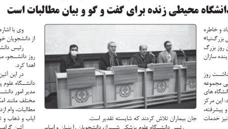
رئیس دانشگاه علوم پزشکی و خدمات بهداشتی درمانی شیراز: ۱۰ سالگی دانشگاه محیطی زنده برای گفت و گو و بیان مطالبات است