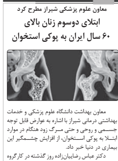
معاون علوم پزشکی شیراز مطرح کرد ابتلای دوسوم زنان بالای ۶۰ سال ایران به بوکی استخوان

معاون بهداشت دانشگاه علوم پزشکی و خدمات بهداشتی درمانی شیراز با اشاره به عوارض قابل توجه جسمی و روحی و حتی مرگ زود هنگام در موارد ابتلا به بوکی استخوان، از افزایش چشمگیر این بیماری در دنیا خبر داد.