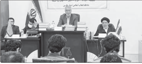
پرونده برقرار شد، گفت: روند رسیدگی به این پرونده ۱۰ جلسه در ششماه اول دادگاه انقلاب اسلامی شیراز به حضور کلیه متهمین، وکلای مدافع آنان و شکات موقوف شد.

استادان فارس در جلسه شورای آموزش و پرورش: