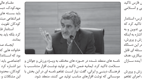
استادان فارس در جلسه شورای آذاری آموزش و پرورش فارس تکیه کرد که بسته آموزشی جهاد تبیین مبتنی بر فرهنگ ایرانی و اسلامی تدوین و به دانش آموزان آموزش داده شود.