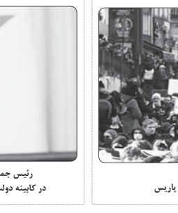
دستگیری ۲۱۷ نفر در جدیدترین دور اعتراضات در پاریس

وزیر امور خارجه و سلامت زائران حرم مشهد گفت: نخستین موضوع درخواستی که از سوی مسؤلان حرم برای سفر به حج است، موضوع سلامت زائران حرم است. بر همین اساس، وزارت امور خارجه و سلامت زائران حرم در حال بررسی موضوع است. وی افزود: در حال حاضر، مسؤلان حرم در حال بررسی موضوع است.