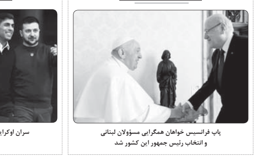
پاپ فرانسیس خواهان همکاری مسؤلان لبنانی و انتخاب رئیس جمهور این کشور شد

وی درباره امکان شیوع دوباره کرونا در سفرهای نوسوزی افزود: ما آماده باش کامل داریم. یکی از کارهای مهم نوسوزی مربوط است به واکسن کسور است که سال گذشته هم گزارش بسیار خوبی در این زمینه منتشر شد. وزیر بهداشت، درمان و آموزش پزشکی گفت: در صورت بروز شیوع خطرناک کرونا در ایران و اروپا، ما آماده باش کامل داریم. یکی از کارهای مهم نوسوزی مربوط است به واکسن کسور است که سال گذشته هم گزارش بسیار خوبی در این زمینه منتشر شد.