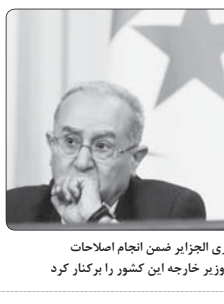
رئیس جمهوری الجزایر ضمن انجام اصلاحات در کابینه دولت، وزیر خارجه این کشور را برکنار کرد

تأخیر ایجاد می کند. برخی منابع اروپایی سه روزنامه بلژیکی افشا کردند: فرانسه برنامه ایجاد لور میس بر کمک به اوکراین جهت افزایش ذخایر مینامه ها را به تعویق می اندازد. روزنامه دیلی تلگراف نوشت: پاریس به دنبال ایجاد تضمینی در خصوص یک قرارداد ۵ میلیارد یورویی برای کشورهای عضو اتحادیه اروپا است که بدین ترتیب خرید مشترک مهمات برای کی یف فقط شامل گولوهایی تولید شده توسط این کشورهای عضو خواهد بود. این قرارداد، افزود: تعدادی از فرانسویان در خواست را در چین گفتگو کرده و برنامه ارائه شده اروپا نسبت به ارسال یک میلیون گولوه تولیدی ۱۵۵ میلی متری مطرح کردند.