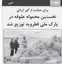
برای حمایت از گور ایرانی نخستین محموله علعوفه در پارک ملی قطریه توزیع شد

در راستای اجرای تفاهنامه حمایت از گور ایرانی نخستین یخس از محموله ۲۰ تنی علعوفه از سوی مجتمع فولاد غدیر نیز به پارک ملی قطریه ارسال و در محل‌های از پیش تعیین‌شده توزیع شد. به گزارش روابط عمومی مجتمع فولاد غدیر نی یخس به دنبال امضای تفاهنامه مشترک میان این مجتمع و سازمان حفاظت از محیط زیست در نمایشگاه محیط زیست در ۵ام سال جاری، اولین اقدام عملی برای حمایت از گور ایرانی اجرائی شد. بر این اساس، در این مرحله قرار است ۲۰ تن علعوفه برای تأمین نیازهای زیستی گور ایرانی به پارک ملی قطریه ارسال شود که در مرحله اول محموله ۱۰ تنی علعوفه به این منظور در منطقه حفاظت شده پارک ملی قطریه و در نقاط از پیش تعیین‌شده توزیع شد. این اقدام با هدف حفظ و تقویت جمعیت این گونه ارزشمند و حمایت از زیستگاههای آن انجام شده است. مسئولان این پروژه از آمادگی و همکاری مردم در این حمایت‌ها بزرگ ملی ترحم و بی‌شمار در اختیار جنوین آن منطقه حفاظت شده به‌پرام گور پرآکنگی دارند. در سنوخت حفاظت شده پارک ملی قطریه ۱۳۰۰ تن علعوفه برای توزیع به‌پرام گور ایرانی قرار داده شده است که با ناچار وارد خارج اطراف پارک شده و در مسیر برکت با ذورعلاج عبوری برخورد و در برخی موارد تلفی می‌شوند.