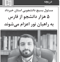
مسئول بسیج دانشجویی استان خیرداد ۵ هزار دانشجوی از فارس به راهیان نور اعزام می‌شوند

رئیس مرکز مدیریت راه‌های استان فارس با اشاره به افزایش ترافیک در محور شیراز - سپیدان، گفت: این محور به دلیل افزایش ترافیک و درآمد، به پردرآمدترین محور استان تبدیل شده است.