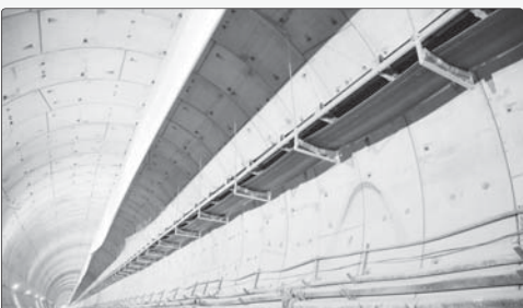
شیراز گفت: این خط ۱۲ کیلومتر طول دارد و از ۷ ایستگاه، مجموعه دیپو و پارکینگ (در انتها) ساخته، کراس‌اوها، صفات تهیه است.

رئیس مرکز مدیریت راه‌های استان فارس با اشاره به افزایش ترافیک در محور شیراز - سپیدان، گفت: این محور به دلیل افزایش ترافیک و درآمد، به پردرآمدترین محور استان تبدیل شده است.