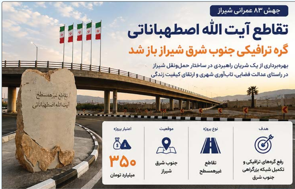
تقاطع غیرهمسطح آیت الله اصطهباناتی

بهره‌برداری از یک شریان راهبردی در ساختار حمل‌ونقل شیراز در راستای عدالت فضایی، تاب‌آوری شهری و ارتقای کیفیت زندگی