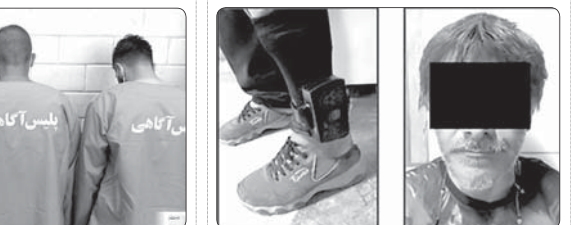
دزدی که ۱۰ فقره سابقه کیفری داشت با پاینده الکترونیکی زیر سبک ظرف‌فروشی منزل دستگیر شد