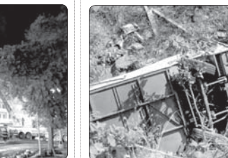
در پی واژگونی یک دستگاه اتوبوس در ایالت «اوآخاکا» در جنوب مکزیک، ۱۱ نفر جان باختند و حداقل ۱۲ نفر دیگر نیز زخمی شدند