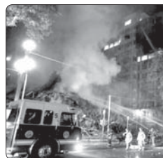
کشته در آتش‌سوزی پناهگاه بی‌خانمان‌ها در تبریز