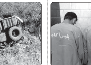
یاند مغوف گروگانگیری و قتل همکارانش شد