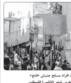
تظاهرات افراد مسلح جنبش «فتح» در حومه غربی شهر «ناحس» فلسطین