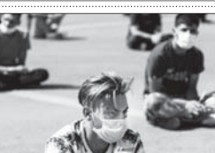
شناسایی افراد گرفتند.

در پایان جلسه قضات وارد شور شدند و با توجه به مدرک‌های موجود در پرونده این اثار فرهاد را به قصاص محکوم کردند. پرونده به دیوان عالی کشور فرستاده شد تا قضاات ایلی تریه به بررسی متوجه‌گانه آن پرونده‌زاد و کمیسیون میان کشمکش بین کسوفوس‌های فراوان مشخص شود.