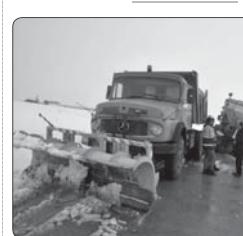
آغاز برف رویی جاده های کوهستانی البرز

طی این حادثه یک دستگاه خاور چرتقیل‌را قصد جابه‌جایی یک دستگاه کانکس را داشته است که بومی چرتقیل با کابل برق بالای آن برخورد می‌کند. ملکی اعلام داد: بارندگی، دایره برق‌گرفتگی را گسترده‌تر کرده بود و مرد ۳۰ تا ۴۰ ساله که برای کار در محل حضور داشتند دچار برق‌گرفتگی شدند. وی ادامه داد: نیروهای آتش‌نشانی اقدامات اولیه را به سرعت انجام دادند و با حضور نیروهای اورژانس در محل مشخص شد که متأسفانه یک نفر از این مرد جان خود را از دست داده و فرد دیگر دچار مصدومیت شدید شده است. فرد مصدوم با وضع وخیم به مرکز درمانی منتقل شد.