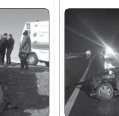
برخورد دو خودرو سواری پژو با اتوبوس در آزاد راه کاشان به قم پنج نفر مصدوم بر جای گذاشت