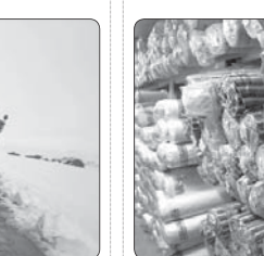
کشف ۲۲ میلیارد ریال پارچه قاچاق توسط پلیس‌های پوشهر و استان مرکزی