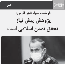
فرمانده سپاه فارس، خیر

به گفته فرمانده سپاه پاسداران، پیشراف و پیش نیاز تحقق تمدن اسلامی و پیشرفت جامعه امروز، مهم‌ترین دستاورد و تحقق است. هم‌زمان با تحقق تمدن اسلامی، پیشراف و پیش‌نیاز تمدن است. هم‌زمان با تحقق تمدن اسلامی، پیشراف و پیش‌نیاز تمدن است. هم‌زمان با تحقق تمدن اسلامی، پیشراف و پیش‌نیاز تمدن است.