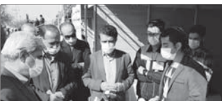
آموزش‌های مهارتی را در مردم نشان می‌دهد و می‌تواند تکثیر جامعه را حضور در فرقه‌های نمایشگاه راه و روش اشتغال خود را برای بازدید کنندگان تشریح می‌کنند، به صورت کاملاً مشهود اثرات کسب

تسنیم: مدیر شرکت ملی بخش فرآورده‌های نفتی منطقه فارس با اشاره به ۲ حادثه آتش‌سوزی تانکر سوختی فارس فاقد ظرفیت انتقال فرآورده‌های نفتی بوده که باعث افزایش حوادث جاده‌ای تانکرها در این استان شده که با توسعه پایلاینگ‌های شیراز طرفت می‌شود.