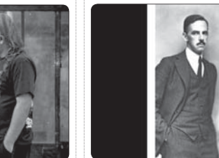
فیلم سینمایی «سپا باز» به کارگردانی حمید همتی که از چند ماه قبل به اکران آمده بود، سرانجام به اکران آنلاین رسید

تجیر دارم که البته این موضوع را نه تنها در نشریات بلکه در فن ساخت و ساز، شعر، آهنگ و موسیقی وارد. هنرمندانی که متأسفانه در چند سال گذشته به دلیل مهجور ماندن موسیقی سنتی استان شان، مهجور شده‌اند. نازمدهد آهنگریک یکی از هنرمندان موسیقی کرمانج شمال استان خراسان و دوتار نواز است.