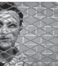
همزمان با پایان تدوین و صداگذاری فیلم سینمایی «روای کاغذی» پوستری این فیلم منتشر شد