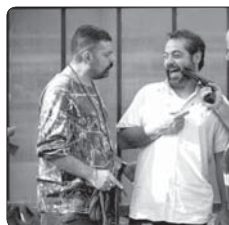
فیلم سینمایی «سپا باز» به کارگردانی حمید همتی که از چند ماه قبل به اکران آمده بود، سرانجام به اکران آنلاین رسید

بزرگداشت آذرتاش آذرنوش بزرگداشت آذرتاش آذرنوش بزرگداشت آذرتاش آذرنوش