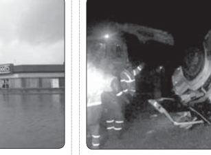
واژگونی یک اتوبوس با ۲۴ سرنشین در جاده دامغان به شاهرود

پلمپ و به ۲۲ و ۱۱ خودرو دیگر نیز تذکر داده شد.