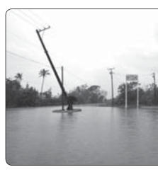
طوفان در شرق کمزگی کوه دانه

فرمانده انتظامی کوه چنار از دستگیری سارق اماکن خصوصی و دولتی با ۱۰ فقره سرقط در این شهرستان خبر داد. سرهنگ کتوفالله محمدی در گفت‌وگو با خبرنگار پایگاه خبری پلیس، بیان کرد: در پی وقوع چند فقره سرقط از اماکن خصوصی دولتی در سطح شهرستان کوجناجر، شناسایی و دستگیری سارق در دستور کار پلیس آگاهی قرار گرفت. وی تصریح کرد: کارآگاهان این فرماندهی با تلاش شهروندی‌های مردمی که کارآگیری گرفت‌های نامحسوس با فقر از سارقان سلسله‌هاجر و حرفه‌ای شناسایی و با هماهنگی کارشناسان در عملیاتی فلانگیرانه وی را در محلیقه‌های مستقری دستگیر کردند. فرمانده انتظامی کوه چنار گفت: متهم در بازجویی اولیه به ۱۰ فقره سرقط از اماکن خصوصی و دولتی اعتراف و پس از سپر مراحل قانونی روانه زندان شد.