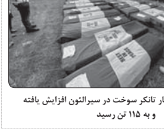
فرباینان حادثه انفجار تاکر سوخت در سیرالئون افزایش یافته و به ۱۱۵ تن رسید

وی ادامه داد: فرد آگهی دهنده با ثبت شرکت و اعطای نمایندگی اقدام به عقد قرارداد به امضای قانونی با شاکیان کرده و سپس از پرداخت چند ماه سود و جلب اعتماد شاکیان متواری شده و دیگر جلوبندی تماس هایش نپوده است. متهم از ۱۵ نفر بیش از ۵۰ میلیارد تومان به این روش کلاهبرداری کرده بود که با تلاش شبانه روزی و رصد هوشمندانه مأموران پلیس فتا مشخص شد و او اهل یکی از استان‌های شمالی کشور است. در تحقیقات بدعی معلوم شد که متهم در این انجام یک کلاهبرداری جدید وارد شهرستان شده که به آنجا ترحم و وی بازداشت شد.