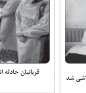
فرباینان حادثه انفجار تاکر سوخت در سیرالئون افزایش یافته و به ۱۱۵ تن رسید

وی ادامه داد: فرد آگهی دهنده با ثبت شرکت و اعطای نمایندگی اقدام به عقد قرارداد به امضای قانونی با شاکیان کرده و سپس از پرداخت چند ماه سود و جلب اعتماد شاکیان متواری شده و دیگر جلوبندی تماس هایش نپوده است. متهم از ۱۵ نفر بیش از ۵۰ میلیارد تومان به این روش کلاهبرداری کرده بود که با تلاش شبانه روزی و رصد هوشمندانه مأموران پلیس فتا مشخص شد و او اهل یکی از استان‌های شمالی کشور است. در تحقیقات بدعی معلوم شد که متهم در این انجام یک کلاهبرداری جدید وارد شهرستان شده که به آنجا ترحم و وی بازداشت شد.