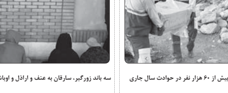
سه باند زورگیر، سارقان به عنف و اراذل و اوباش در کرمان متلاشی شد

وی ادامه داد: فرد آگهی دهنده با ثبت شرکت و اعطای نمایندگی اقدام به عقد قرارداد به امضای قانونی با شاکیان کرده و سپس از پرداخت چند ماه سود و جلب اعتماد شاکیان متواری شده و دیگر جلوبندی تماس هایش نپوده است. متهم از ۱۵ نفر بیش از ۵۰ میلیارد تومان به این روش کلاهبرداری کرده بود که با تلاش شبانه روزی و رصد هوشمندانه مأموران پلیس فتا مشخص شد و او اهل یکی از استان‌های شمالی کشور است. در تحقیقات بدعی معلوم شد که متهم در این انجام یک کلاهبرداری جدید وارد شهرستان شده که به آنجا ترحم و وی بازداشت شد.