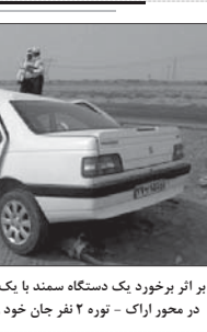
بر اثر برخورد یک دستگاه سمند با یک دستگاه پژو ۴۰۵ در محور اراک - بروجرد ۲ روزه ۳۰ نفر جان خود را از دست دادند

فرمانده انتظامی فیروزآباد از کشف انواع کالای قاچاق به ارزش ۲۴ میلیارد و ۶۲۶ میلیون ریال خبر داد. سرهنگ مهدی جوکار در گفتگو با خبرنگار پایگاه خبری پلیس، بیان کرد: در اجرائی طرح سه روزه مبارزه با قاچاق کالا، مأموران انتظامی شهرستان فیروزآباد هنگام ایتست و بازرسی و کنترل محورهایی فیروزآباد موصلائی به ۱۰ دستگاه خودرو سبک و سنگین مشکوک و آنها را برای بررسی بیشتر متوقف کردند.