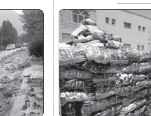
کشف ۲۲ میلیون تومان لباس قاچاق در سلسله لرستان