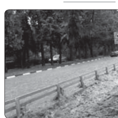
سیلاب ۲۶۲ میلیارد تومان به زیرساخت‌های راسر خسارت زد