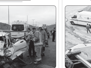
سختجوی سازمان اورژانس کشور از آمار بالای حوادث ترنفلت ترافیکی در اورژانس کشور خبر داد