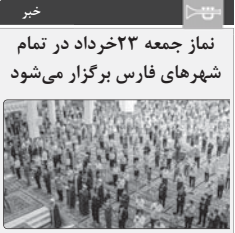
مدیر دفتر نمایندگی شورای سیاست گذاری امده جمعه گفت: نماز جمعه این هفته در استان فارس در تمامی شهرستان های فارس و در ۷۶ شهر استان برگزار می شود.

نماز جمعه ۲۳ خرداد در تمام شهرهای فارس برگزار می شود