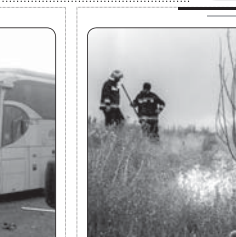
آتش بخشی از شبه جزیره میانکاله را در بر گرفت