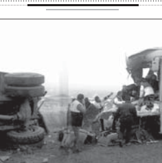
تصادف اتوبوس مسافری در جاده زنجان تلافات جانی داشت