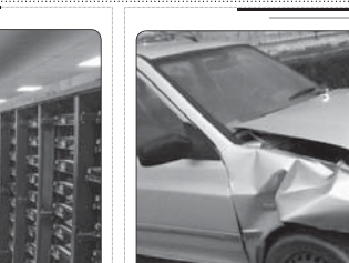
ساخته رانندگی در محور قدیم قم - اسفهان ۲ مدموم برجا گذاشت