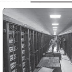
مایترهای غیرمجاز کشف‌شده در سمنان به سه هزار و ۳۸۰ دستگاه رسید

ایستاد: شخگوی سازمان آتش نشانی و خدمات ایمنی شهرداری تهران از حریق خودروی بی ام و جانباختن دو تن در بزرگراه خیر دادیس جلال ملکی در بزره جزیبات این حادثه گفت: یک بصد حادثه تصادف منجر به حریق خودرو به سالا ۱۲۵ سازمان آتش نشانی و خدمات ایمنی شهرداری تهران اطلاع داد شد که بلافاصله پس از آن دو تن عملیاتی یک گروه حریق به یک گروه نجات به محل حادثه اعزام شدند.وی ادامه داد: آتش‌نشانی شهرداری کردند یک دستگاه خودروی بی ام و شامسی بلنده به دلایل نامشخص هنگام حرکت با گذراندن های بزرگراه برخورد کرده و منحرف شده است. این خودرو در حالیه بزرگراه با یک پست برق و یک ایلمه درخت برخورد کرده و باعث کشش شده آن شده بود. ملکی گفت: متأسفانه خودرو در اثر شدت برخورد، دچار آتش‌سوزی شده بود و دو نفر داخل خودرو محبوس بودند. قضی به این نشان به محل رسانند خودرو کاملاً شعله رو بود. وی ادامه داد: آتش‌نشانی به سرعت حریق را اطفا کردند و هر دو نفر را خارج کردند. وی افزود: مشخص شد هر دو نفر جان خود را از دست دادند. پلیس راهنمایی و رانندگی تهران بزرگ تن علت وقوع این حادثه را سرعت غیر مجاز اعلام کرد.