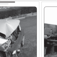
تصادف اتوبوس مسافری در جاده زنجان تلافات جانی داشت