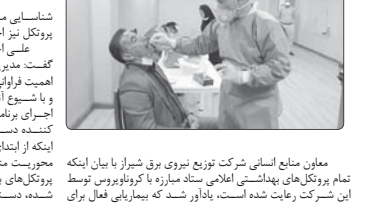
معاون منابع استانی شرکت تعاونی نیروی برق شیراز با این تیم همکاری می‌کند.

جانشین استاندار فارس در ستاد استانی مدیریت بحران گفت: برگزاری آیین شبهای قدر در ۳۶ شهر استان فارس در روزهای ۲۷ و ۲۸ شهریور ماه ۱۳۹۶ برگزار خواهد شد.