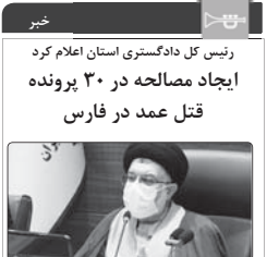
رئیس کل دادگستری استان اعلام کرد ایجاد مصالحه در ۳۰ پرونده قتل عمد در فارس

رئیس کل دادگستری استان فارس گفت: ابتدای سال جاری تا کنون ۳۰ قفسه قتل عمد در فارس به مصالحه رسیده و با برقراری صلح و سازش محکومان به قصاص از طاب در راهی یافتند. حجت الاسلام و المسلمین سید کاظم موسوی اظهار داشت: برقراری صلح و سازش در پرونده‌های قضایی از اولیای‌های مجموعه حقوقی می‌شود و خوشبختانه استان فارس در ۷ سال متوالی موفق به کسب رتبه برتر در زمینه صلح و سازش در پرونده‌های قتل شده است. وی اظهار داشت: شورای حل اختلاف با بهره‌مندی از ظرفیت افراد توانمند و معتمدان و ریش سفیان برای برقراری صلح و سازش و ترغیب همه نوان به گذشت گام مهمی برداشته و آثار و ثمرات آن در جامعه مشهود می‌باشد. نماینده عالی قوه قضائیه در استان فارس خاطرنشان کرد: از ابتدای سال جاری تا پایان خرداد ماه تعداد ۶۲ هزار نفر پرونده به مرکز توسعه حل اختلاف استان وارد شده و از این تعداد بیش از ۳۷ هزار نفر پرونده قابلیت صلح و سازش داشته که تلاش می‌شود در مسیر سازش قرار گیرد و منجر به مصالحه شود. حجت الاسلام و المسلمین موسوی با اشاره به اهداف انحصاری ستاد مسر در کشور نیز گفت: بهترین هدف تفکیک از این ستاد گسترش فرهنگ صلح و سازش و ارتقای فرهنگ مدارا و مسرت، کاهش ورودی پرونده در دستگاه قضا و تبع آن راستا از جمعیت کفبری زجران‌هاست که در این استان نیز مشارکت و همکاری سازمان‌ها و نهادهای با دستگاه قضایی مورد نیاز است. وی با اشاره به تأکیدات و نگاه ویژه حجت الاسلام و المسلمین ازای ریاست جدید معظ قوه قضاییه در خصوص لزوم بسط و گسترش فرهنگ صلح و سازش در جامعه، از عموم مردم خواست که در سال جاری نیز با دستگاه قضایی در مسیر ترویج و توسعه فرهنگ صلح و سازش، تعامل و همکاری داشته باشند.