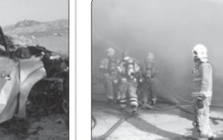
وقوع حریق در یک انبار لاستیک در پامنار تهران