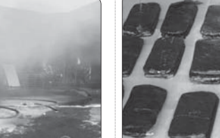
کشف ۳۰۵ کیلوگرم مواد مخدر در یزد