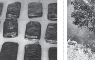
آتش سوزی، ۲۲ میلیارد ریال به مزارع استان یزد خسارت زد