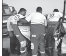
تصادف مرگبار پژو با وانت حامل سوخت در اصفهان

فرار گرفت این مقام انتظامی افزود: با انجام تحقیقات میدانی و تجزیه و تحلیل اخبار و اطلاعات توسط عوامل انتظامی، باند ۴ نفره سارقان شناسایی و پس از هماهنگی با مقام قضائی، در مخفیگاهشان دستگیر شدند. سرهنگ زارع‌رور اظهار داشت: متهمان در بازجویی اولیه و مواجه شدن با اادله و مستندات پلیس،