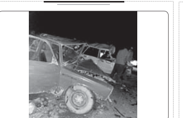
چهار کشته در حادثه رانندگی در ایرانشهر