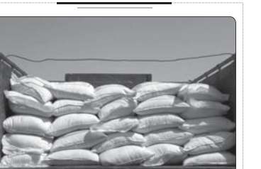
کشف ۲۵ تن شکر قاچاق در بروجرد