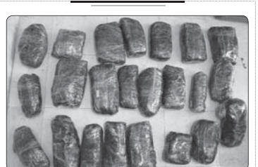
کشف ۲۰۷ کیلوگرم تریاک در یزد

ملکی افزود: آتش نشنان بلافاصله عملیات را آغاز کردند و این خانم را از خودرو بیرون آوردند اما متأسفانه متخض شد که بر اثر از دست جرحات وارده شده جان خود را از دست داده است.سوی در حادثه خودرو به محل امن منتقل شد و با حضور عوامل پلیس راهم تراکفیک به حالت دایمی بازگشت. این مصدوم ساعت ۴ و یک دقیقه با یک جاب‌باخته و دو معلول به پایان رسید.