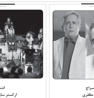
مهمزبان با آغاز اکران آنلاین فیلم «تیغ و ترمه» به کارگردانی کیومرث پوراحمد از تیزر این فیلم رونمایی شد

یکی دارد و بازمره است، یکی لزومی نداشت ما در سرپال‌مان همان‌ها را تکرار کنیم و فکر می‌کنیم در سرپال «فون‌خ» در این زمینه تادی نبوی موق هم شدیم.