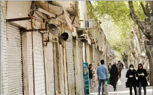
«ساخته» از پیشرو مشاغل آسیب‌پذیر در ایام همه‌گیری کرونا ویرایش گزارش می‌دهد