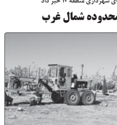
مناطق ویژه گانه ای خود. «پهنازی و زیرساختی ورودی غربی شیراز»

معاون بهره برداری شرکت برق منطقه ای استان فارس گفت: حوادث شبکه برق در فارس و جنوب کشور ۱۷ درصد کاهش یافته است. وی افزود: این امر به دلیل بهسازی شبکه و افزایش طول عمر تجهیزات است.