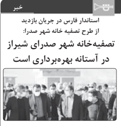
استاندار فارس در جریان بازدید از طرح تصفیه خانه شهر صدرا.

استاندار فارس با اشاره به اقدامات دولت تدبیر و امید در تکمیل زیرساخت‌های عمرانی شهرهای جدید گفت: بر همین اساس تصفیه خانه شهر صدرا تا ۹۵ درصد پیشرفت فیزیکی داشته و بهر حال در پایان سال جاری ۱۰۰ درصد تکمیل خواهد شد.