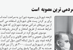
رئیس شورای شهر شیراز گفت: مصوبه ساماندهی میدان عدالتی در نظر قبلی از دستور خود در جلسه علنی شورای شهر شیراز در ۲۸ خرداد رد شد.

لیلا اکبرزاده؛ رئیس شورای شهر شیراز گفت: مصوبه ساماندهی میدان عدالتی در نظر قبلی از دستور خود در جلسه علنی شورای شهر شیراز در ۲۸ خرداد رد شد. در این جلسه، اعضای شورای شهر شیراز با تصویب این مصوبه موافقت نکردند. در این جلسه، اعضای شورای شهر شیراز با تصویب این مصوبه موافقت نکردند.