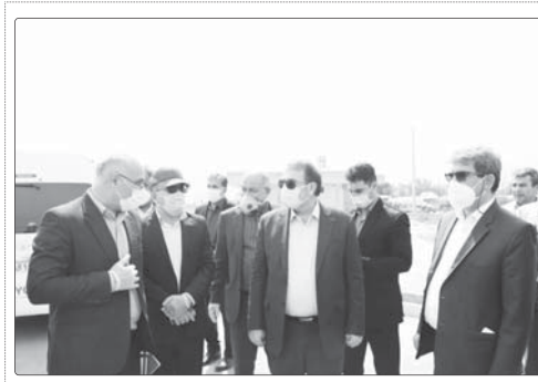
گفتنی است استاندار فارس به همراه مدیر کل بخش فرآورده‌های نفتی استان و مدیر کل حفاظت محیط زیست استان و مسئولین پایگاه از بخش‌های مختلف طرح توسعه پایگاه شیراز بازدید کرد.

رئیس جامعه هتلداران فارس: ایستادن: رئیس جامعه هتلداران فارس گفت: مسافران تعطیل شده هتل‌ها در استان فارس در حال حاضر تعطیل شده است. وی با اشاره به اینکه هتل‌ها در استان فارس در حال حاضر تعطیل شده است و هیچ‌کدام از آنها برای بازگشایی آماده نیستند، گفت: ما در حال حاضر هیچ‌گونه برنامه‌ریزی برای بازگشایی هتل‌ها نداریم.