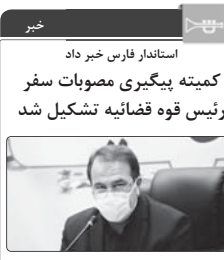
استادان فارس خبر داد کمیته پیگیری مصوبات سفر رئیس قوه قضائیه تشکیل شد

استادان فارس گفت: مصوبات سفر رئیس قوه قضائیه در قالب کمیته ای متشکل از دستگاههای مرتبط جهت عملیاتی کردن مصوبات تشکیل شده است. به گزارش پایگاه اطلاع رسانی استانداری فارس، دکتر عنایت الله رحیمی ضمن تقدیر از سفر ریاست قوه قضائیه آیت الله العظمی روحانی، رئیس قوه که در این سفر دستاوردهای مثبتی برای استان در پی داشته است، وی با بیان اینکه کمیته مذکور مصوبات را تا حصول نتیجه پیگیری می کند، اظهار کرد: این مصوبات در ارتباط با رفع مشکلات پیمان روی چشم تولید، تسریع در پرونده های مفتوح، رسیدگی به پرونده های مفتوح بنگاه های اقتصادی و رفع مشکلات واحدهای تولیدی تعطیل شده با هدف از سرگیری فعالیت آنها و مسائل مربوط به معاش استان است.