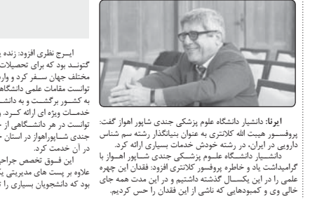
پرفسور هیبت الله کلاتری به عنوان بنیانگذار رشته سم شناسی دارویی در استان بوشهر

دانشیار دانشگاه علوم پزشکی اهواز: خدمت ارزنده پرفسور کلاتری در سم شناسی دارویی بیادماندنی است. دکتر سید کسرمیری افزود: براین اساس در زمان حاضر شهرستان‌های دیر و تنگان از توابع استان بوشهر در شرایط قرمز برخطر قرار دارند. وی اظهار کرد: همچنین شهرستان سلبویه نیز که تا هفته گذشته در وضع قرمز گرونیای قرمز داشت در رنگ بندی جدید سامانه ماکمل به رنگ نارنجی برخطر تغییر رنگ درده، براین اساس شهرستان‌های سلبویه، دشتی، گناوه، دشتستان و بوشهر در وضعیت نارنجی قرار دارند. کسرمیری ادامه داد: براساس آخرین بررسی‌ها بندهای سامانه شهرستان‌های ملیم، تنگستان و تنگان در وضع قرمز و رنگ زرد به خطر متوسط قرار دارند. دبیر ستاد مقابله با کرونا استان بوشهر گفت: با توجه به شیوع سوزش جدید افریقای در استان بوشهر بعنوان یکی از شهرستان‌های همجوار در