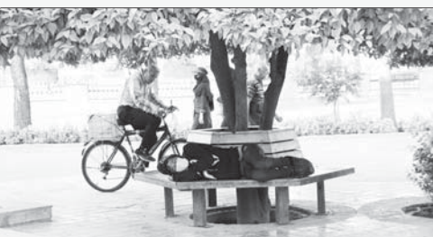
معاون حمل و نقل و ترافیک شهرداری شیراز: ناوگان اتوبوسرانی روز شنبه ۱۱ مرداد بازگشایی می‌شود

روز گذشته خبر همه‌گیری کرونا در استان فارس، مدیرکل ارتباطات و روابط عمومی استانداری فارس اظهار کرد: محمد باقر نوبخت معاون رئیس جمهور و رئیس سازمان برنامه و بودجه کشور امروز در سفر به استان فارس از پتانسیل‌های موجود در استان بازدید خواهد کرد. او تصریح کرد: با بازدید از کارخانه سدیم سولفات و قطار شهری شیراز از جمله برنامه‌های است که در این سفر برنامه‌ریزی شده است. عباس باجانی خانی بیان کرد: در صورتی که امکان برگزاری شورای اداری استان فارس فراهم باشد شورای اداری با حضور معاون رئیس جمهور و رئیس سازمان برنامه و بودجه کشور بر گزار خواهد شد.