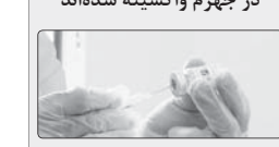
معاون دانشگاه علوم پزشکی جهرم اعلام کرد که تاکنون بالغ بر ۴۰ درصد از اعضای گروه‌های هدف در این شهرستان بالغ بر یکصد واریکس کووید-۱۹ واکسینه شده‌اند.