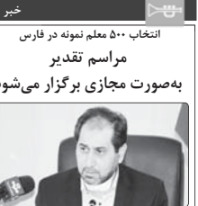
انتخاب ۵۰۰ معلم نمونه در فارس