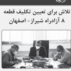
طی جلساتی با حضور استاندار فارس و نفر از متناهیان مردم شیراز و زرقان در مجلس شورای اسلامی، پروژه تعیین تکلیف قطعه ۸ آزادراه شیراز - اصفهان، تاکیه شد.

جسمی در فرآیند خانگی بوده و سلامت آنان به صورت منظم پیگیری می‌شود.