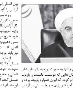
فرمانده کل ارتش:

رئیس‌جمهور گفت: آمریکا و رژیم صهیونیستی بر آژانس بین‌المللی انرژی فشار آورده‌اند و ما می‌تسیم که این شیادان، حجت الاسلام حسن روحانی رئیس‌جمهور تصریح کرد: من می‌دانم که مردم ما مشکلات دارند و قیمت‌ها در نوسان بوده و این افزایش قیمت، مردم را آزار می‌دهد. هر روز موفقی مردم را آزار می‌دهد. این مشکلات هر چند قطع است اما قدرت عبور از آن را داریم. یطی اظهار داشت: شرایطی که در اسفند و فروردین ماه‌ها شرایط بسیار سخت و صدمات و واردات قطع شده بود، مزرها بسته بود و همه در دو کمره کرونا بودند. شرایط در اردیبهشت و مخصوصاً خرداد بهتر شد و ما دو ماه قبل، قابل مقایسه نیست.