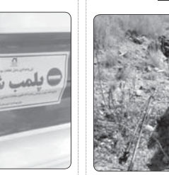
یکمیر بی جان کوهنورد اصفهانی پس از ۱۲ روز در داموند پیدا شد.