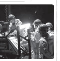
پلمپ ۹۰۹ واحد صنعتی متخلف در خوزستان