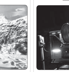
یکمیر بی جان کوهنورد اصفهانی پس از ۱۲ روز در داموند پیدا شد.