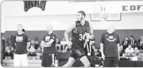
دورانت در سبتمبر ۲۳ ساله شد و دو سال پیش دچار پارگی آشیل، حضور او در لیست متعجب بسیاری را برانگیخته است. با توجه به تعطیلی NBA، درک است که دورانت روند سلامتی و بهبود خود را در این تابستان در اولویت قرار دهد.

اما با این حال دورانت از این تعطیلی بهره برده و تمام توان خود را صرف تلاش کسب سومین مدال طلا خواهد کرد. کارملو آنتونی با سه مدال طلا تنها بسکتبلیست مرد تاریخ بوده که موفق به کسب چنین دستاوردی شده است. در میوند گرین که با دورانت به تیم المپیک ۲۰۱۶ هم‌رود بود، بعد انتقال دورانت به بروکلین در سال ۲۰۱۹، برای اولین بار در کنار هم تیمی سابقش در گلندل استیت ویاویور به دو تیم با توجه به اینکه