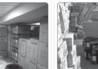
کشف ۳ میلیارد تومان کالای قاچاق در دشتستان