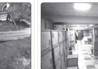
کشف انبار لوازم خانگی قاچاق در کرج