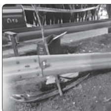
تصادف خونین اتوبوس و کامیون در آزادراه قزوین- زنجان

فرمانده انتظامی فیروزآباد ارزش سم‌های کشاورزی کشف شده را برابر نظر کارشناسان، ۵ میلیارد و ۱۵۰ میلیون ریال عنوان کرد و گفت: متهم برای سیر مراحل قانونی تحویل مراجع قضایی شد.