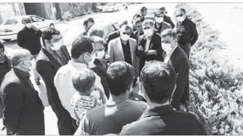
حال طی فرآیند خود است. گفتنی است در این بازدید موضوعاتی نظیر وضع بهداشتی، زیست محیطی، دفع اسفالت و دیگر مشکلات مورد بررسی قرار گرفت.