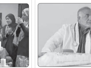
فیلم کوتاه «گوسفند» به نویسندگی و کارگردانی سیدمهران قفیری پس از ۶۰ روز پیش تولید و چهار روز فیلمبرداری در مراحل فرای قرار دارد.

ایستادفرزند پرویز پورحسینی است که علت ابتلا به کرونا در بیمارستان بستری است، گفت: شرایط جسمی پدرم در مرحله ثبات است و به بهبودی امیدواریم. پرویز پورحسینی درباره روند درمانی پرویز پورحسینی - بازیگر سینما، تئاتر و تلویزیون - بیان کرد: خوشبختانه در حال حاضر همه چیز بیانات به نظر می‌رسد و صحبت مفصلی هم با پزشک ایشان داشته که از روند درمان راضی هستند. البته هنوز تنها و ناشناخته و غربی است. اندیشمندی خارق‌العاده با فعالیت‌های بسیار و کتاب‌های فراوان، چگونه در کشور خود بی نام و نشان است؟ من نیز چون باقوت حموی باید بگرمم و خدا من را احدا من اهل العلم ذکری فی کتاب و لامدحه فی ضمن خطاب و هذا من العجب العجیب.