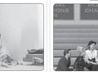
میل استرپی با «جشن آیان سال» مراسم آیین اسکا شد.