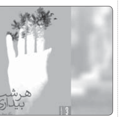
رمان «هر شب بیداری» منتشر شد