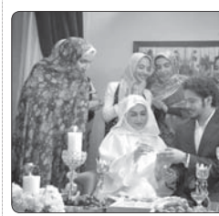
فیلم کوتاه «تاق عقد» جلوی دوربین رفت