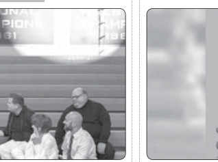
هر شب بیداری