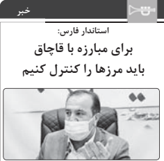
استاندار فارس: برای مبارزه با قاچاق باید مرزها را کنترل کنیم

استاندار فارس با تأکید بر این که در زمینه مبارزه با قاچاق باید به سمت کنترل مرزها برویم، گفت: وجود حدود ۲۰۰ هزار نفر اتباع خارجی و همسایگی با هفت استان که در برخی زمینه های جرم خیز هستند، کنترل قاچاق در این استان با پنج میلیون نفر جمعیت ۳۶ شهرستان ادوشاری می کند. به گزارش پایگاه اطلاع رسانی استانداری فارس، دکتر عنایت الله رحیمی در دیدار سردار اصلی معاون ستاد مبارزه با مواد مخدر، اظهارداشت: امکانات موقر و نیاز برای مدیریت آسیب های اجتماعی و مسئله با ناهنجاری ها و قاچاق باید به صورت متناسب در اختیار استان ها قرار گیرد تا مدیران استانی و شهرستانی بتوانند در این زمینه با موفقیت عمل کنند. دکتر رحیمی صریح کرد: دوگانگی ایجاد شده در زمینه های فرهنگی، اجتماعی و اقتصادی موجب آسیب های اجتماعی می شود.