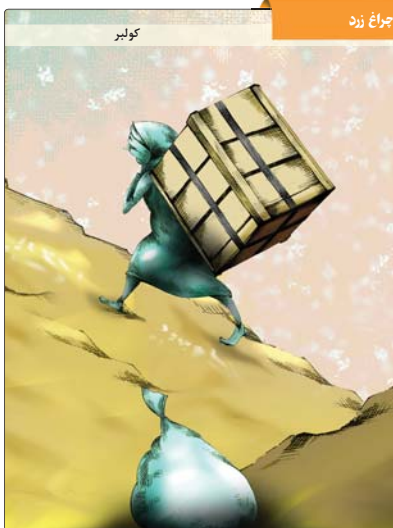
طرح: بنیامین آل علی کولبر