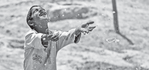
نگری در حال انجام است و بیوسفته آب قابل دسترس و ذخیره را کمتر می کنیم

و بیوسفته آب قابل دسترس و ذخیره را کمتر می کنیم