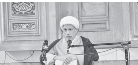
موقیبت‌های پلیس در عملیات‌ها و ماموریت‌های خود افزود: مردم باید همواره پشتیبانان نیروی انتظامی

نماینده ولی فقیه در فارس در جمع تعدادی از فرماندهان نیروی انتظامی استان عنوان کرد