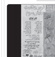
نمایشنامه «ترس و نکبت رایش سوم» اثر برتولت برشت به کارگردانی امیر امیری خوانش می‌شود

فانتزی برداشتی آزاد از سری داستان‌های حماسی ده ده دوره‌ای است. نویسنده ادامه داد: ملکه جادوگر «ماموشی‌ها» برای صاحب سرزمین تورکان سالها با نقشه می‌کشد و بابت اجرای نقشه به کمک جنگچوهاش یک شهر شگفت‌انگیز می‌سازد. او تدارک جنک با تورکان را مهیا کرده که سرورگه پسر نوجوان قوی‌هنگی به نام «یولبارس» پیدا می‌شود. اوفق افزود: یولبارس جوانی غادی نیست. او زمان‌های خیلی دیو هنگام حاکمیت پدرش بر سرزمین تورکان که نوزادی