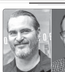
استودوی ۸۲۴ به عنوان تهیه‌کننده و تأمین‌کننده مالی فیلم جدید آرس آستر قدم جلو گذاشت تا فیلمی با بازی خاوین فینکس را بسازد

ایستادگان سینمایی ترولایی در حالی از وضع اسفناک کتاب‌های شعر نوجوان می‌گوید که معتقد است وضعیت شعر نوجوان بسیار درخشان است و درخشان هم خواهد شد. سراینده مجموعه شعر «اراز در خودم می‌بارد» که در یازدهمین دوره جشنواره شعر «فجر» برگزیده شده است، در توضیحی درباره این کتاب بیان کرد: «این کتاب برای من بسیار عجیب است، اتفاقاتی متفاوت برای آن افتاده. پیش از هر چیزی تمام شعرهایش را در حال و هوای اندوه در دست دادن پدرم گرفته‌ام، این روز اغلب شعرهای این کتاب مضمون مرگ دارند. او سپس گفت: «همچنین صبح روز بیستوششم به‌هم‌سامه که این اختتامیه جشنواره شعر «فجر» می‌رفتم، موبایل‌م را که روشن کرده به طرز عجیبی فوت اولین مربی و استادم در زمینه شعر آقای عبدالرضا مزاری جلای را شنیدم. ایشان در کانون پرورش فکری کودکان و نوجوانان کسر رشک که من را در کودکی عضو آن دیده، اولین کسی بودند که من را با ادبیات و شعر آشنا کردند و من سال‌ها خدمتشان شایردی کردم و متأسفانه بیست‌و پنج‌هفته‌ها من این خبر را شنیدم. من صبح فریادش که این خبر را شنیدم، برای کتابی به سمت مراسم پایانی جشنواره رفتم که حال و هوای از دست دادن پدرم را داشت و شعرهای کتاب به در تعیین شده‌اند. همه این اتفاقات برای من عجیب بود و در عین حال که این برگزیده شدن کتاب خوشحال‌بوم، همزمان و اومان هم از دست دادن آقای جلای و اندوه از دست دادن پدرم همراه