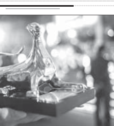
جشنواره فیلم لوکاتیکو بخش جدید برای فیلم‌های کوتاه از سال ۲۰۲۱ راه‌اندازی کرد

ایستادگان سینمایی ترولایی در حالی از وضع اسفناک کتاب‌های شعر نوجوان می‌گوید که معتقد است وضعیت شعر نوجوان بسیار درخشان است و درخشان هم خواهد شد. سراینده مجموعه شعر «اراز در خودم می‌بارد» که در یازدهمین دوره جشنواره شعر «فجر» برگزیده شده است، در توضیحی درباره این کتاب بیان کرد: «این کتاب برای من بسیار عجیب است، اتفاقاتی متفاوت برای آن افتاده. پیش از هر چیزی تمام شعرهایش را در حال و هوای اندوه در دست دادن پدرم گرفته‌ام، این روز اغلب شعرهای این کتاب مضمون مرگ دارند. او سپس گفت: «همچنین صبح روز بیستوششم به‌هم‌سامه که این اختتامیه جشنواره شعر «فجر» می‌رفتم، موبایل‌م را که روشن کرده به طرز عجیبی فوت اولین مربی و استادم در زمینه شعر آقای عبدالرضا مزاری جلای را شنیدم. ایشان در کانون پرورش فکری کودکان و نوجوانان کسر رشک که من را در کودکی عضو آن دیده، اولین کسی بودند که من را با ادبیات و شعر آشنا کردند و من سال‌ها خدمتشان شایردی کردم و متأسفانه بیست‌و پنج‌هفته‌ها من این خبر را شنیدم. من صبح فریادش که این خبر را شنیدم، برای کتابی به سمت مراسم پایانی جشنواره رفتم که حال و هوای از دست دادن پدرم را داشت و شعرهای کتاب به در تعیین شده‌اند. همه این اتفاقات برای من عجیب بود و در عین حال که این برگزیده شدن کتاب خوشحال‌بوم، همزمان و اومان هم از دست دادن آقای جلای و اندوه از دست دادن پدرم همراه