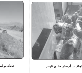
کشف ۱۲۱ پرنده قاچاق در آبهای خلیج فارس