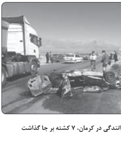
حادثه مرگبار رانندگی در کرمان، ۷ کشته بر جا گذاشت

خجسته: فرمانده انتظامی ویژه غرب استان تهران گفت: فردی که در پوششی فروش خودرو از شهرتاند ۱۰۰ میلیارد ریال کلاهبراری کرده بود، توسط کارآگاهان پلیس شهرتاند دستگیر شد. سردار حسن خجسته اظهار کرد: در پی شکوائت ایلامتخا مبنی بر اینکه فردی در پوششی نامبندی یکی از شرکت های فروش و عرضه خودرو از آنان کلاهبراری کرده است، بررسی موضوع در دستور کار کارآگاهان پلیس آگاهی شهریار قرار گرفت.فرمانده انتظامی ویژه