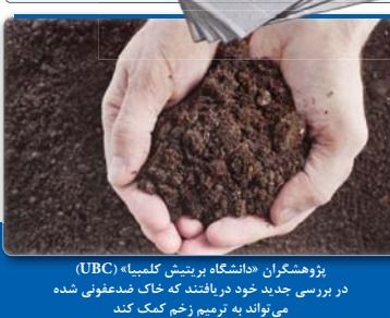
پژوهشگران «دانشگاه بریتیش کلمبیا» (UBC) در سوئیس جدید خود دریافتند که خاک مدفون شده می تواند به ترمیم زخم کمک کند