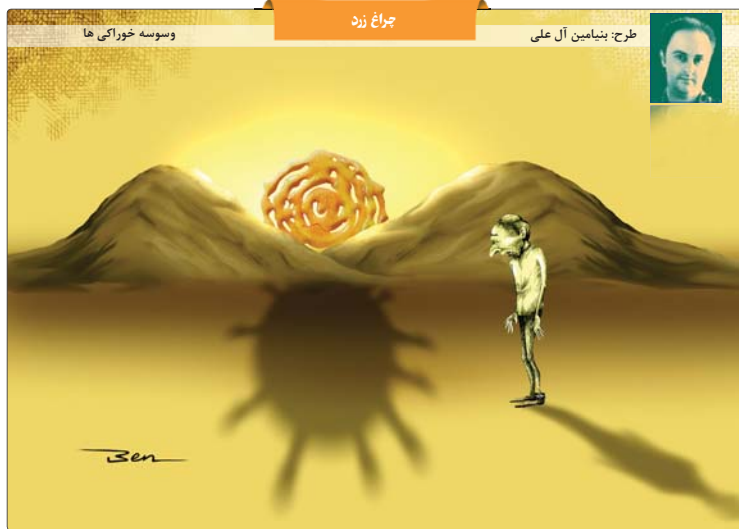
طرح: بنیامین آل علی چراغ زند وسوسه خوراکی ها

پنجشنبه ۱۱ اردیبهشت ۱۳۹۸ ۶۵ رمضان ۱۴۴۱ هـ ۲۰۲۰ آوریل ۱۶ شماره ۷۱۳۶