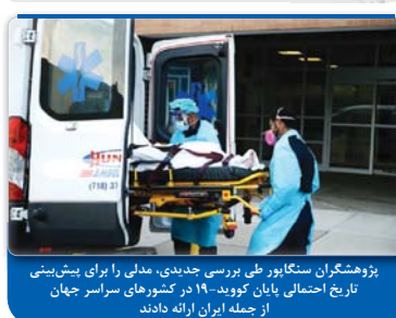
پژوهشگران سنسگاپور طی بررسی جدیدی، مدلی را برای پیش بینی تاریخ احتمالی پایان کووید-۱۹ در ۱۹۰ کشورها سراسر جهان از جمله ایران ارائه دادند