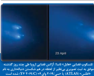
تلسکوپ فضایی «هابل» تا ۱۰ اترن فضای اروپا طی چند روز گذشته موفق به ثبت تصویری بنظیر از لحظه در هم شکستن دنباله داری به نام «طلسن» (ATLAS) با «سنی ۲۰۱۹» و «ای ۲۰۱۹/C» شده است