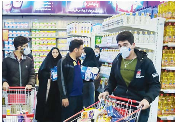
«افسانه» از کیبورد روغن در شیراز و تکمیل بخشی از فروشگاه‌های خرید اجباری شهروندان گزارش می‌دهد

مردان بیشتر از زنان کرونا می‌گیرند و مرگ و میر آنها هم بر اثر این ویروس بیشتر بوده است. در ایمنی‌ها ریسک روابط اجتماعی برای مردان بالاتر است به این دلیل ساده که آنها بنا به عادت و تربیت به سلامت خود بها نمی‌دهند یا چنان در معرض استرس و فشار مسئولیت و خانه هستند که مجالس برای پیگیری سلامت خود ندارند. هزینه‌ها نیز مهمند که به نسبت پایین‌تر از زن به‌های درآمدی امکان سالم‌سازی هم ندارند. آنها هم که در پله‌های بالاتر هستند و امکان دارند آن را در مصرف‌های زینباز به کار می‌انداختند. در نتیجه این هشدار را که سلامت خود را جدی بگیرد جدی نمی‌گیرند. بنا به آمار وزارت بهداشت اعتیاد در مردان ۱۰ برابر زنان، مرگ و میر ناشی از حوادث و سقوط آبرام و مرگ ناشی از سوانح ترافیکی ۵ برابر است و لی اینها فقط چند مورد از خطاهای است که در مردان را تهدید می‌کند. آنان در برابر استرس محیطی و شغلی حساس‌تر هستند. پذیرش به اعتیاد و سرگرمی‌های زین آور گرایش بسیار بیشتری دارند. نسبت به امکانات و فضای اجتماعی کمتر ورزش می‌کنند و از همه مهم‌تر در برنامه‌های بهداشتی خیلی کم به حساب آورده و مشارکت ندهی می‌شوند. این مورد باید دغدغه‌ی آنان را باعث شود اگر احساس مسئولیت نسبت به سلامتی خودشان و سرخوش خانواده و جامعه در آنان برانگیخته شود؛ یعنی همان چیزی که برای آن تا به حال کاری نشده است. با آنکه جامعه مردسالار است و این تصور است هنوز باقی مانده، مردان در سرزنش عمومی سلامت نفس و اثر چندانی ندارند. این نارسایی به میزانی که آگاهی مردان کمتر است و در گروه‌های حاشیه‌ای جامعه و کم درآمد شدیدتر است.