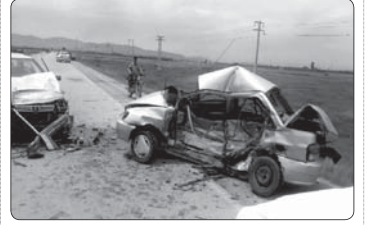
پرخورد و پراید در محور شهرهایک به هرات پنج مصدوم بر جای گذاشت