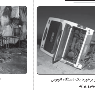
مصدومیت ۲۵ نفر بر اثر برخورد یک دستگاه اتوبوس با خودرو پراید

ایرنا: رئیس پلیس آگاهی ایلام گفت: هشت سارق حرفه ای با ۶۰ فقره سرقت در این استان دستگیر شدند.سرهنگ علی مهزی اظهار داشت: طرح ارتقا امنیت اجتماعی در راستای برخورد با سارقان و ارتش شهروندان طی یک ماه گذشته در این استان به مرحله اجرا در آمد.وی با اشاره به اجرای موفق این طرح پیشگیرانه پلیس افزود: هشت سارق در سطح شهرستان ایلام در طول اجرای این طرح با انجام اقدامات پلیسی و رصد اطلاعاتی شناسایی و پس از هماهنگی با مقام قضایی در چند عملیات جنازه دستگیر شدند. رئیس پلیس آگاهی استان ایلام با بیان اینکه در تحقیقات پلیسی مأموران دستگیر شده به ۶۰ فقره سرقت از مغازه، منزل، داخل خودرو معترف شدند، ادامه داد: در بررسی از محل اختفای این سارقان مقداری اموال سرقتی به ارزش چهار میلیارد ریال کشف و تحویل مالباختگان شده است.سهری با بیان اینکه شناسایی و دستگیری ۲ مالخر از دیگر نتایج این طرح بوده تصریح کرد: متهمان دستگیر شده به همراه پرونده برای تسبیر مراحل قانونی و معالیه به حق مردمی تحویل مراجع قضایی شدند.