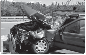
حادثه رانندگی در جاده اردستان به کاشان ۶ نفر از مصدوم کرد