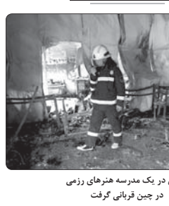
حریق در یک مدرسه هنرهای رزمی در چین قربانی گرفت

فرمانده انتظامی اردکان از دستگیری ۳ سارق یک باغچه نقره فروشی در این شهر که دوربین نداشت، خبر داد و گفت: حدود سه میلیارد ریال اموال سرقه به مالباخته تحویل شد. سرهنگ اکبر شرفی افزود: با اعلام یک فقره سرقت از مغازه نقره فروشی و با توجه به حساسیت موضوع مراتب به صورت ویژه در دستور کار عوامل انتظامی شهرستان ایلام قرار گرفت. مأموران با استفاده از شاگردهای خاص پلیسی و اطلاعاتی در کمنر از ۱۲ ساعت سارقان را همراه افراد مسرفه دستگیر کردند و سارقان در تحقیقات انجام شده به چندین فقره سرقت دیگر نیز اعتراف کردند.