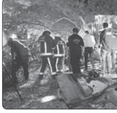
در تصادف اتوبوس حامل تعدادی مهاجر در نزدیکی مرز ترکیه دسکم ۱۲ تن کشته شدند

فرمانده انتظامی داراب از کشف یک دستگاه خودرو مسروقه در این شهرستان خبر داد. سرهنگ علیرضا نونشاد اظهار داشت: مأموران کلاstrی ۱۱ داراب حین گشت ریزی در سطح شهر به یک دستگاه مشکوک توجه کردند. در حاشیه خیابان بانک بود و با شناسایی کلاهک‌های آن، بررسی خودرو و استعلام به عمل آمده مشخص شد خودرو مورد نظر از شهرستان قلم مورد سرقت واقع شده است. فرمانده انتظامی داراب با بیان اینکه خودرو به پارکینگ منتقل و اقدامات اولیه برای تحویل آن به مالباخته انجام شده است، گفت: تلاش برای دستگیری سارق ادامه دارد.