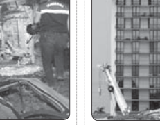
شمار قربانیان حادثه ویرش برج مسکونی ۱۲ طبقه در شهر میامی در ایالت فلوریدا آمریکا به ۸۶ تن افزایش یافت

منابع بیمارستانی در گزارش به نیروهای انتظامی مستقر در یکی از بیمارستان‌های مشهد، خبر از فوت مشکوک یک بیمار می‌دهند. با حضور مأموران انتظامی و تحقیقات اولیه مشخص می‌شود که