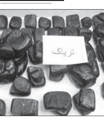
کشف ۱۲۰ کیلوگرم تریاک در چهارمحال و بختیاری

فرمانده انتظامی لرستان گفت: در تلاش مأموران انتظامی این شهرستان ۱۰۰ کیلو تریاک کشف و یک قاچاقچی دستگیر شد. سرهنگ دارو احمدی در این خصوص اظهار داشت: مأموران انتظامی لرستان هنگام کنترل خودروهای عبوری در محور بندرعباس - درزاسبان، به یک سواروی قوه ۴۰۵ و مقننون و دستور ایست را صادر کردند. مأموران انتظامی پس از طی سلفتنی تعقیب و در یک موقف شدند خودرو را توقیف و در بازرسای از ۱۰۰ کیلو تریاک کشف کنند. فرمانده انتظامی لرستان با بیان اینکه در این خصوص یک قاچاقچی حرفه‌ای دستگیر و پس از سر مراحل قانونی روانه زندان شد، تصریح کرد: مبارزه بی امان با سوداگران مرگ به صورت ویژه در دستور کار پلیس این شهرستان قرار دارد.