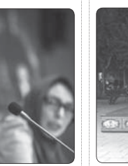
تغییر «شاه چراغ» با رعایت پروتکل های بهداشتی اجرا شد