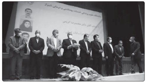
تأمین استان و همکاران سیاسی استانداری صورت گرفته است.

دستگاهی برتر است که خدمت به مردم را علاوه بر وظیفه قانونی، رسالت انسانی و عبادت الهی بداند