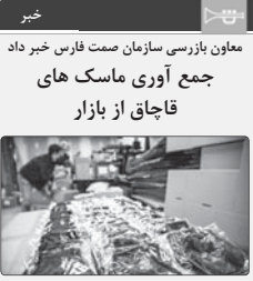
معاون بازرسی سازمان صحت فارس خرد خیر جمع آوری ماسک های قاچاق از بازار