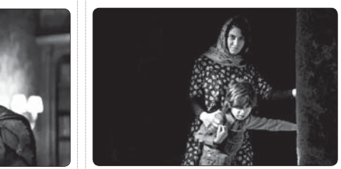
فیلمبرداری فیلم ترساک «قاموس» به پایان رسید

وی تصریح کرد: انسان به هر چه بخواند می‌یابد دست پیدا کند و این موضوع، سنگی به مسیری دارد که در آن قدم می‌زند که او را از هفتاد دور می‌کند یا نزدیک می‌سازد. استاندار فارس با تأکید بر این که در دوران کودکی ایجاد قوانین و ساز کارهای مناسب آن بنا براختند.