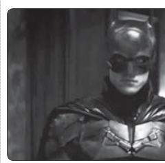
فیلم سینمایی «هنم» از فهرست اکران سینماهای جهان در سال ۲۰۲۱ خارج و با تصمیم کمیته جهانی «اداران وارنر» اکران آن به سال آینده موکول شد