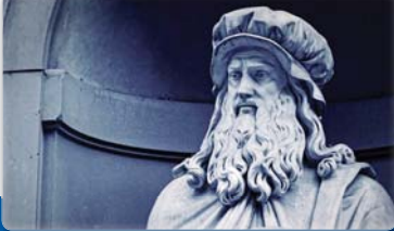
در بررسی‌های جدید شجره‌نامه لئوژاود وادوینی هنرمند، مخترع و کالبدشناس بزرگ دوره رنسانس مشخص شده است که او ۱۴ خویسواند مرد زنده دارد

روایتی از آثار تازه محمد شهباء پژوهشگر، مترجم و استاد دانشگاه، با این توضیح که به‌زودی کتاب «کنداکوی روان‌شناختی» از مکلرگد و تاتیر هنر نوشته آلن وینر به پایان می‌رسد، گفت: این اثر وینر معروف که در سال ۲۰۱۹ نشر یافته است برسی می‌کند چرا هنر بر ما تأثیر می‌گذارد؟ چرا برای یک نابالغ همدردی فراوانی پرداخت می‌کنیم؟ چرا موسیقی عموگ گوش می‌دهیم؟ چرا فیلم‌های ژانریک می‌بینیم؟ اصلاً هنر چقدر چیست و هنر مدرن چه کار می‌کند؟ او این کتاب را کلاماً علمی و فلسفی افروزد. مولود مطرح شده در کتاب توسط پژوهشگران آرمایش، سپس نتایج آن نشر یافته است؛ مثلاً در مورد این که گفته می‌شود موسیقی مهارت‌های ریاضی بچه‌ها را افزایش می‌دهد این ادعا درست است یا نه؟ این که چرا با ترسیم داستان‌ها و فیلم‌ها همدردی می‌کنیم یا این که ما در واقع می‌توانیم شناسایی کنیم که چرا موسیقی ما را تأثیر می‌دهد. البته علاقه‌مندان به «کنداکوی روان‌شناختی» در مکلرگد و تاتیر هنر» و انتشارات منشر افکار منتشر می‌شود. شهباء درباره وضعیت کتاب «ظرفیه‌های زائر در سینما» نیز اظهار داشت: کتاب تحویل انتشارات هرس شده اما دو سه بار ساختار آن تغییر کرده. عنوان آن نیز فعلاً به «زائر سینما» تغییر یافته است. او هم چنین در مورد مجموعه «سینما امروز جهان» که به‌مصرف قراره است، تصریح کرد: این مجموعه مدام بازنویسی می‌شود. فیلم‌های جدید و مهم می‌آیند، فلسفه، آمیختن‌های تازه و... این‌ها کن‌ها به آن افزوده می‌شود. می‌توان آن‌ها را پرورش و مهم ساخته شده گذر کرد.