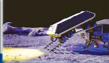
مدعینان فضایی می‌خواهند سطح ماه را برای برداشت آب متعجز کنند و این اتفاق می‌تواند در سال ۲۰۲۲ رخ دهد