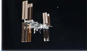
روسیه اخیراً تهدید به ترک ایستگاه فضایی بین‌المللی (ISS) کرده است و این می‌تواند تأثیر زیادی در آینده این ایستگاه فضایی داشته باشد و آن را به انتهای راه خود نزدیک کند