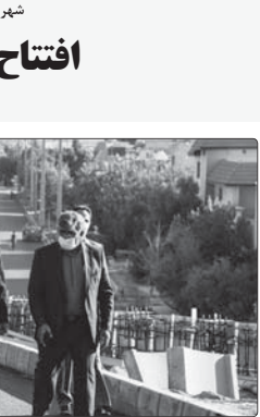
شهردار شیراز در بازدید از تقاطع آماده افتتاح شهدان یغمور (شهید باهنر - کمریندی - فرهنگیان) نوید داد