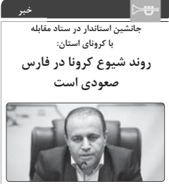
جانشین استاندارد در ستاد مقابله با کرونا ایستاد: روند شیوع کرونا در فارس صعودی است

ایستاد جانشین استاندارد فارس از صعودی شدن روند ابتلا به بیماری کروناویروس ۱۹ در این استان طی روزهای اخیر خبر داد و از شهروندان خواست که همچنان در رعایت پروتکل‌های بهداشتی، با هدف حفظ سلامت خود و خانواده، کوشا باشند.