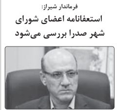
فرماندار شیراز: استعفانامه اعضای شورای شهر صدرا بررسی می‌شود

ایستاد جانشین استاندارد فارس از صعودی شدن روند ابتلا به بیماری کروناویروس ۱۹ در این استان طی روزهای اخیر خبر داد و از شهروندان خواست که همچنان در رعایت پروتکل‌های بهداشتی، با هدف حفظ سلامت خود و خانواده، کوشا باشند.