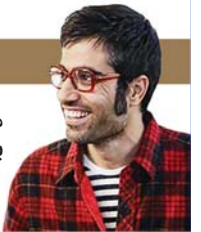
محمد کارت امسال برای سینما «سوپرایز» دارد